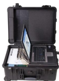
Maleta de transporte de ONEPROD VMS 16 o 32 canales con conectores BNC

(Disponible con distintos niveles de funcionalidad y con o sin PC)