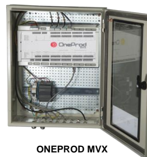
ONEPROD MVX Armario pre-equipado

(Disponible con distintos niveles de funcionalidad y con o sin PC)